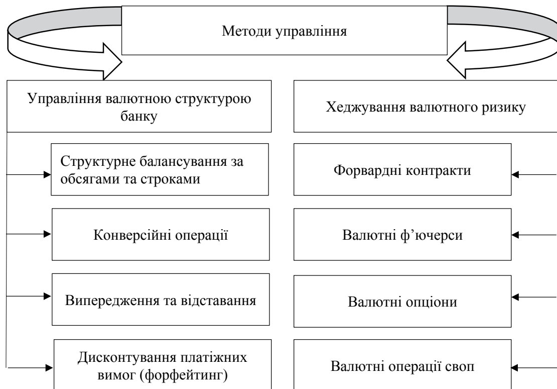
Рис. 1. Класифікація методів управління валютною позицією комерційного банку

Дві групи наведених методів розкривають вплив на валютну структуру балансу для обмеження та уникнення наслідків переоцінки валютних інструментів. Відповідно, в першій