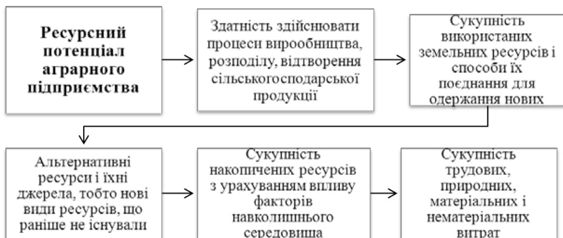
Рис. 1. Схема функціональної залежності ресурсного потенціалу аграрного підприємства

Дослідження сучасних публікацій з питань оцінки, формування й використання ресурсного потенціалу дає змогу зробити висновок про те, чим є ресурсний потенціал підприємства (рис. 1).