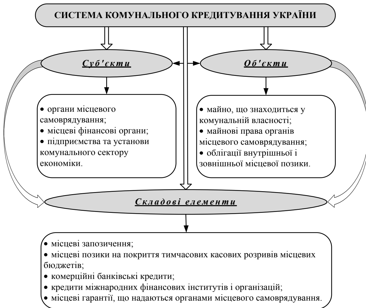
Рис. 1. Структура системи комунального кредитування України