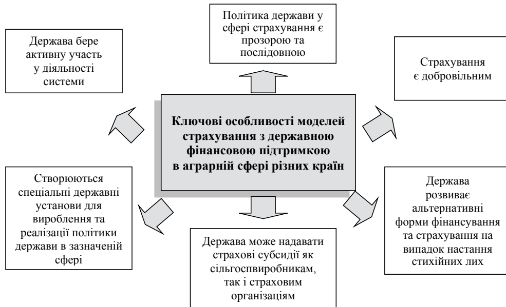
Рис. 4. Особливості моделей страхування з державною фінансовою підтримкою в аграрній сфері в різних країнах