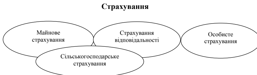
Рис. 1. Місце сільськогосподарського страхування в загальній системі страхування

Сільськогосподарське страхування розгалужене поняття і до його складу входить багато різних видів страхування як майнових, так і відповідальності. Тому воно є підгалуззю як майнового страхування, так і страхування відповідальності (рис. 1), які,