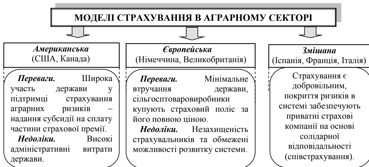
Рис. 2. Сукупність моделей страхування в галузі сільськогосподарського виробництва

Саме така система страхування сільськогосподарських ризиків діє в Іспанії, яка, за оцінками експертів міжнародного проекту ЄС Tacis «Вдосконалення управління ризиками фермерських господарств та малих і середніх господарств в аграрному секторі», є країною з найрозвиненішою системою агрострахування в Європі.