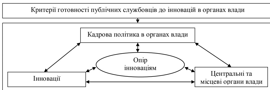
Рис. 2. Складові процесу здійснення інноваційної діяльності органами публічної влади

Слід зазначити, що управління професійною компетентністю публічних службовців має реалізуватися на основі проведення оцінювання рівня їх професійної компетентності (шкала рівнів професійних компетентностей, інтегральний показник оцінки рівнів професійних компетентностей та ін.). На основі цього далі здійснюється коригування оціненого рівня професійної компетентності публічних службовців шляхом проведення професійного навчання, підвищення кваліфікації, само-