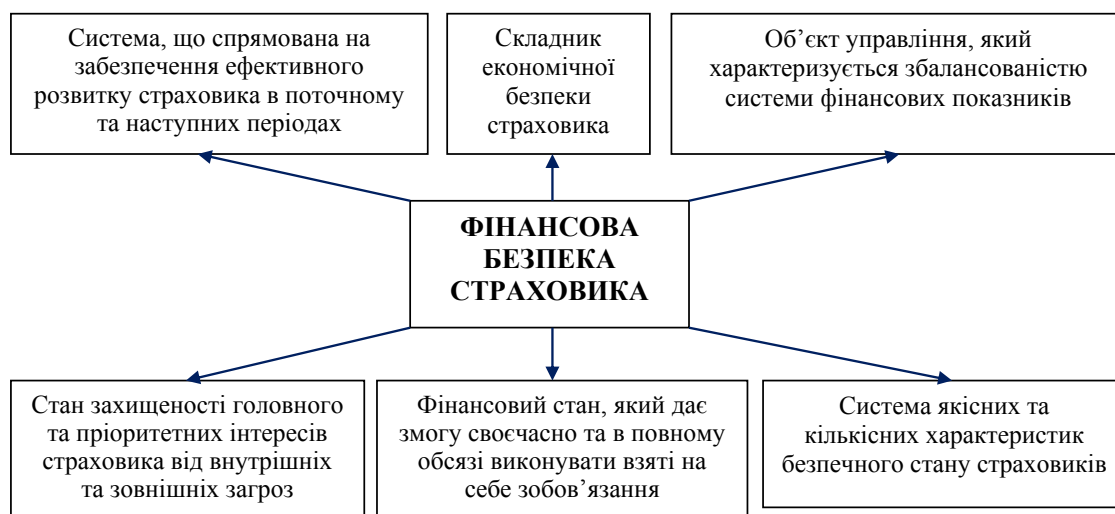
Рис. 1. Основні сутнісні характеристики фінансової безпеки страхових організацій

Як видно з наведеного рисунку, фінансова безпека страхової організації виступає складником економічної безпеки; це також система, спрямована на забезпечення ефективного розвитку страховика в поточному та наступному періодах. Отже, фінансовий складник економічної безпеки є фундаментальною основою економічно ефективною страхової компанії, тобто такої, котра відстоює інтереси як власників організації, так і страхувальників і забезпечує свою фінансову безпеку як у поточному періоді, так і на пер-