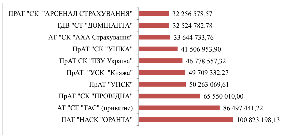
Рис. 1. Динаміка найбільших страхових компаній за сумою страхових премій у 2017 році (грн.)