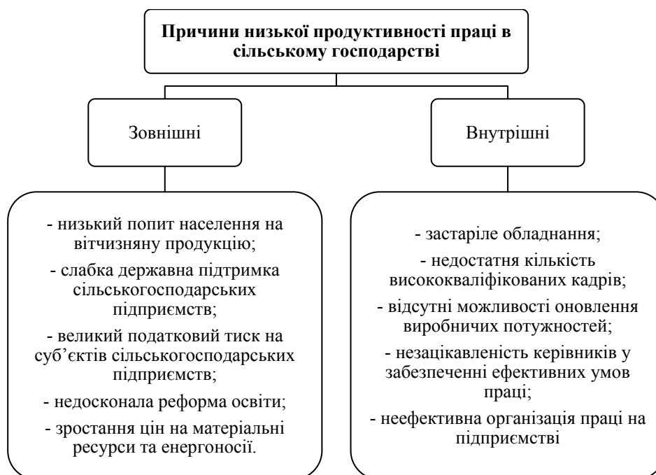
Рис. 2. Причини низької продуктивності праці в сільському господарстві