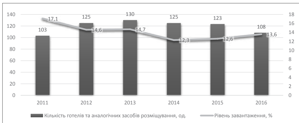
Рис. 4. Показники кількості готелів і аналогічних засобів розміщування та рівні їх завантаження в Харківському регіоні (2011–2016 рр.)

а) будуть визначати та регламентувати роль і місце готельного бізнесу в економічній та правовій сферах;