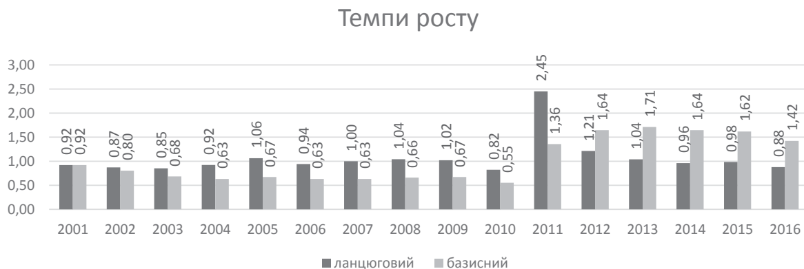
Рис. 3. Темпи росту кількості готелів та аналогічних засобів розміщення в Харківському регіоні (2000–2016 рр.)

в 2011 р. спостерігається різке підвищення кількості готелів (+145% відносно 2010 р. та +35,5% відносно 2000 р.), яке повільно продовжується протягом 2012 р. (+21,4% відносно 2011р.) та в 2013 р. майже зупиняється (+4% відносно 2012 р.). Причиною цього явища було проведення в місті чемпіонату з футболу «Євро-2012». А з 2014 р. з'являється тенденція до спаду. Темпи росту та абсолютний приріст показані на рис. 1, 2.