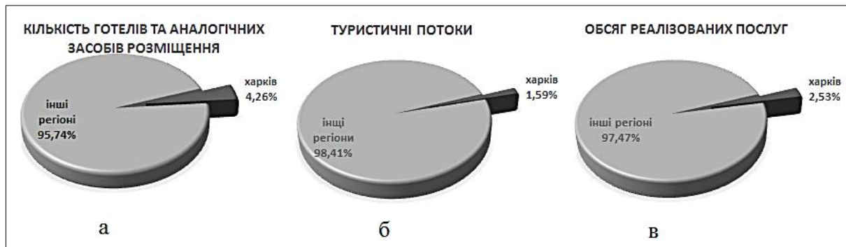
Рис. 6. Показники частки Харківського регіону в розрізі загальнодержавних показників