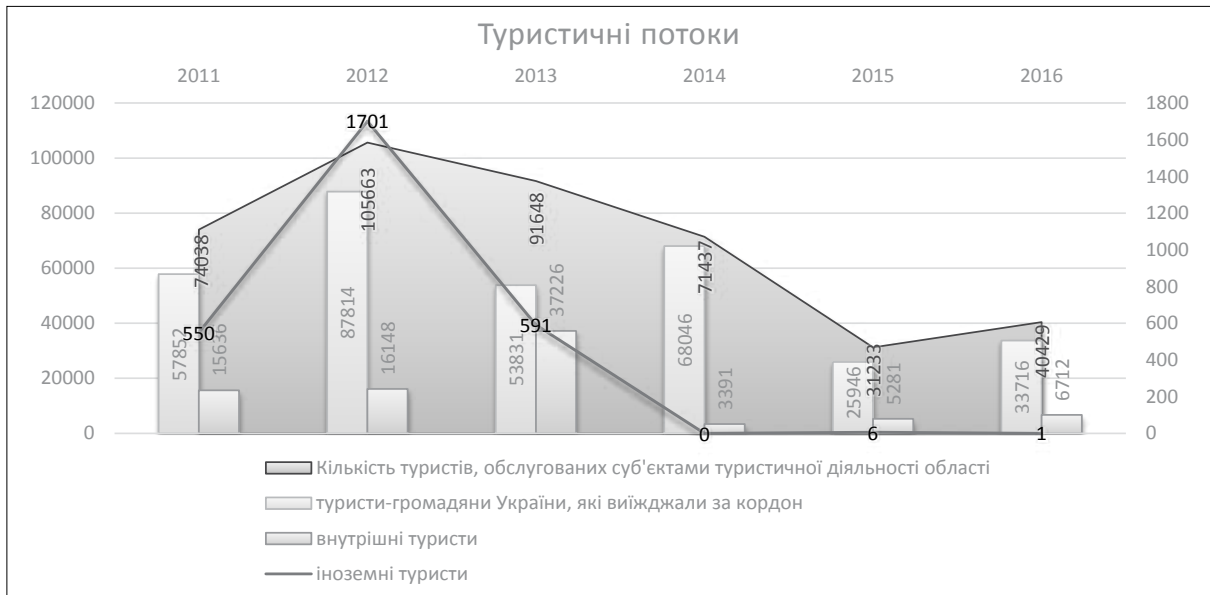
Рис. 5. Кількісні показники туристичних потоків у Харківському регіоні, 2011–2016 рр. [9]