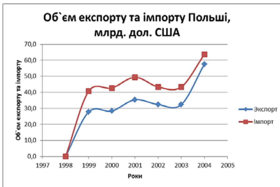
Рис. 4. Обсяг експорту та імпорту Польщі (1994–2004 рр.) [7]

політичною силою. Вона отримала хороший результат на виборах, увійшла в парламент і навіть стала частиною правлячої коаліції разом із правою консервативною партією Ярослава Качинського. Як політична сила «Самооборона» зросла на протестах фермерів, які, боячись вступу в ЄС, блокували дороги і влаштовували акції протесту.