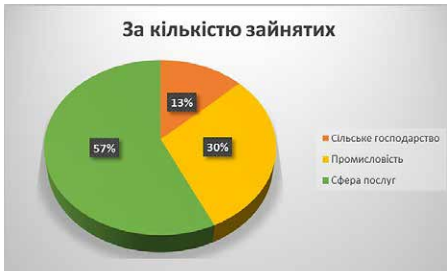
Рис. 7. Структура ВВП Польщі [7]

лові товари – 41%, продукти харчування – 21%. Імпорт становив 198,5 млрд дол. У структурі імпорту переважають машини і транспортне обладнання – 38%, інші промислові товари – 21%, хімікати – 15%, енергоносії – 26%. Головним торговим партнером є Німеччина. Одним із головних партнерів залишається Росія.