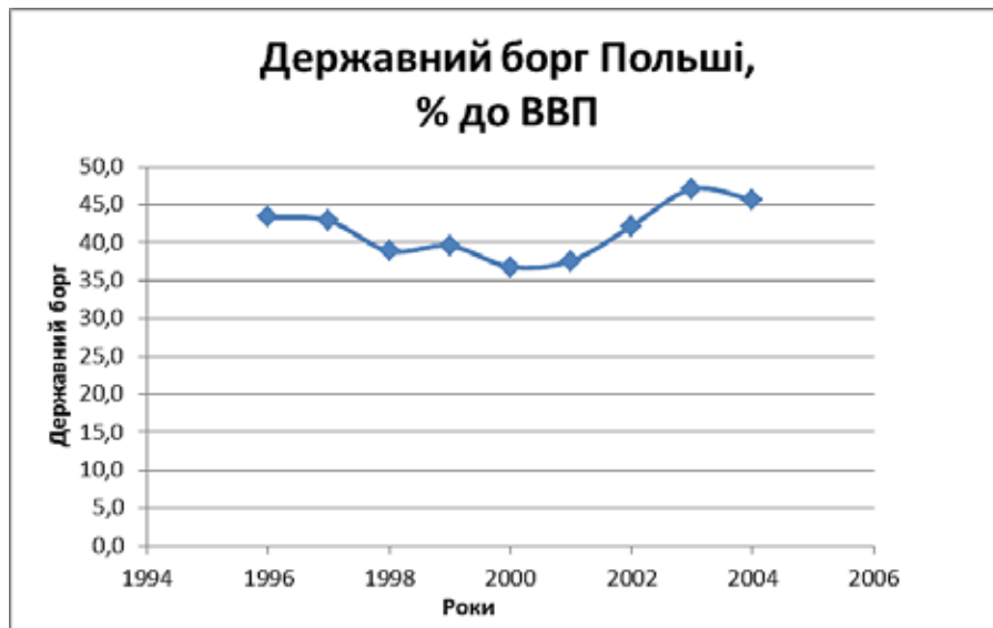
Рис. 5. Державний борг Польщі (1994–2004 рр.) [7]