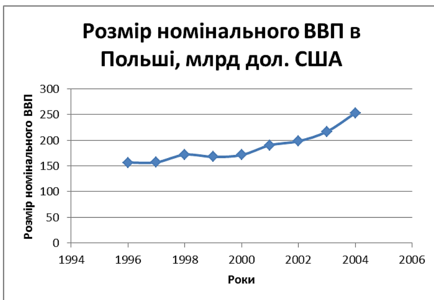
Рис. 2. Розмір номінального ВВП в Польщі (1994–2004 рр.) [7]

Тенденції зміни експорту та імпорту схожі. З 1998 року і до 2004-го обсяг експорту та імпорту збільшувався з незначними коливаннями (рис. 4).