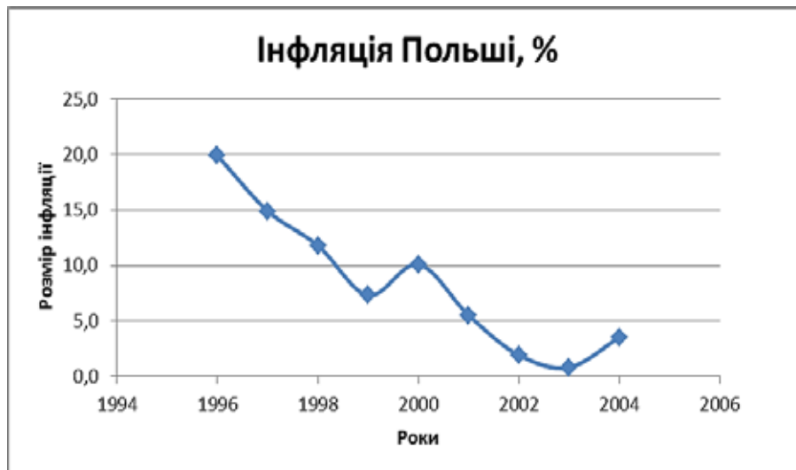
Рис. 3. Інфляція в Польщі (1994–2004 рр.) [7]