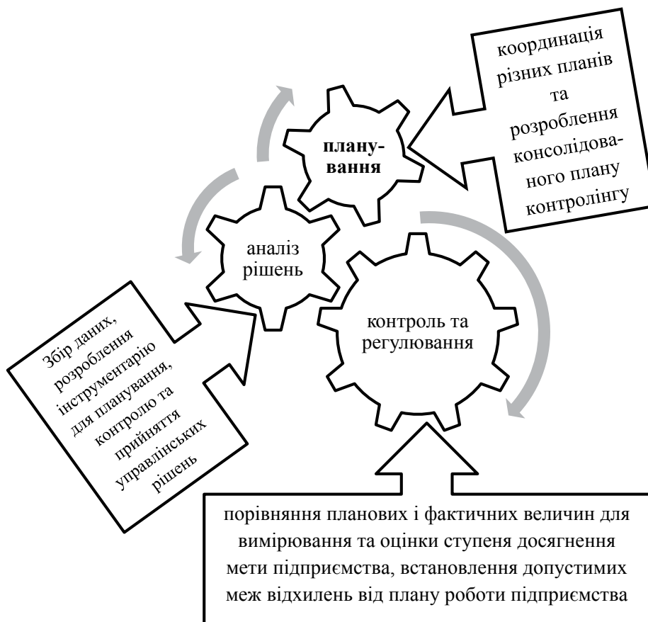
Рис. 1. Взаємозв'язок функцій контролінгу

Аналізуючи позицію автора [1], можна зробити висновок про те, що головною функцією контролінгу є планування, оскільки дві інші функції базуються саме на ньому: контроль та регулювання (функція, спрямована на порівняння планових і фактичних величин для вимірювання та оцінки ступеня досягнення мети підприємства, встановлює допустимі межі відхилень від плану роботи підприємства); аналіз рішень (функція, пов'язана зі збором більш значущих для контролінгу даних, та розроблення інструментарію для планування,