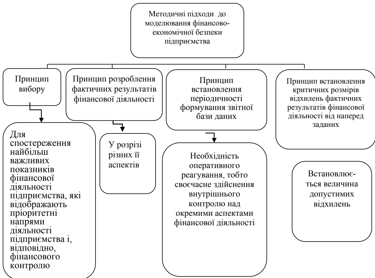
Рис. 1. Моделювання економічної безпеки на підприємстві

вання тощо. Дія таких загроз призводить до значних утрат і збитків та, як наслідок, кризового стану підприємства [9, с. 10].