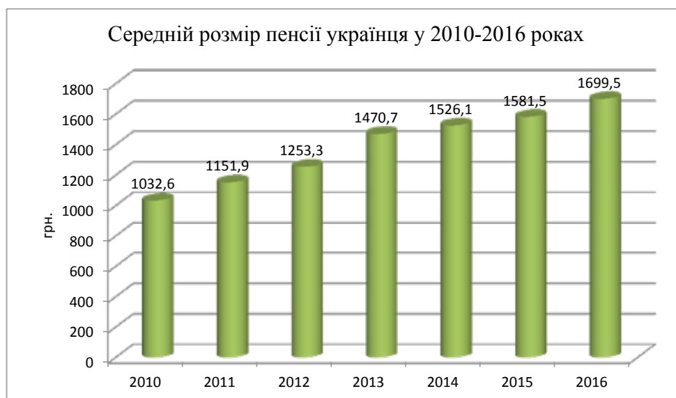
Рис. 1. Середній розмір пенсії українця у 2010–2016 роках

Моніторинг зазначеної діаграми показав, що ситуація з рівнем місячної пенсії українця виглядає таким чином. Суттєвих позитивних зрушень протягом аналізованого періоду не спостерігається. Станом на 2010 рік цей показник складав 1 032,6 грн., а у 2012 році він дорівнював 1 253,3 грн., що лише на 220,7 грн. більше, ніж у 2010 році. У 2014 році рівень щомісячної пенсії українського пенсіонера збільшився до позначки 1 581,5 грн., а у 2016 році місячна пенсія дорівнювала 1 699,5 грн. Вра-