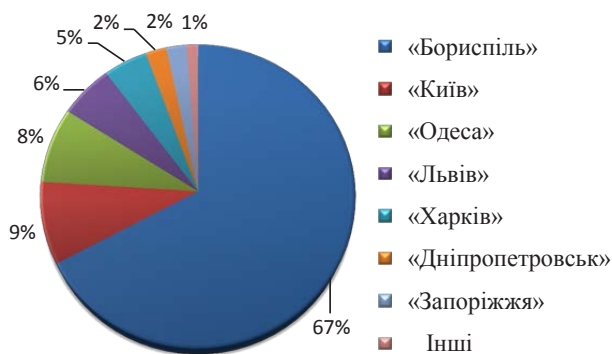
Рис. 2. Питома вага аеропортів у загальних обсягах пасажирських перевезень України у 2016 р.

У 2016 році аеропорти країни обслужили 12 928,8 тис. пасажирів, де 67% від усього обсягу перевезень здійснив аеропорт «Бориспіль» (рис. 2).