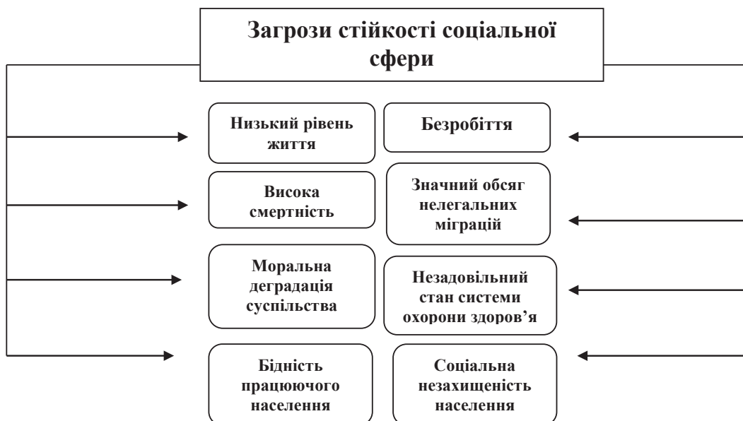
Рис. 2. Чинники, що гальмують процеси формування стійкості соціальної сфери