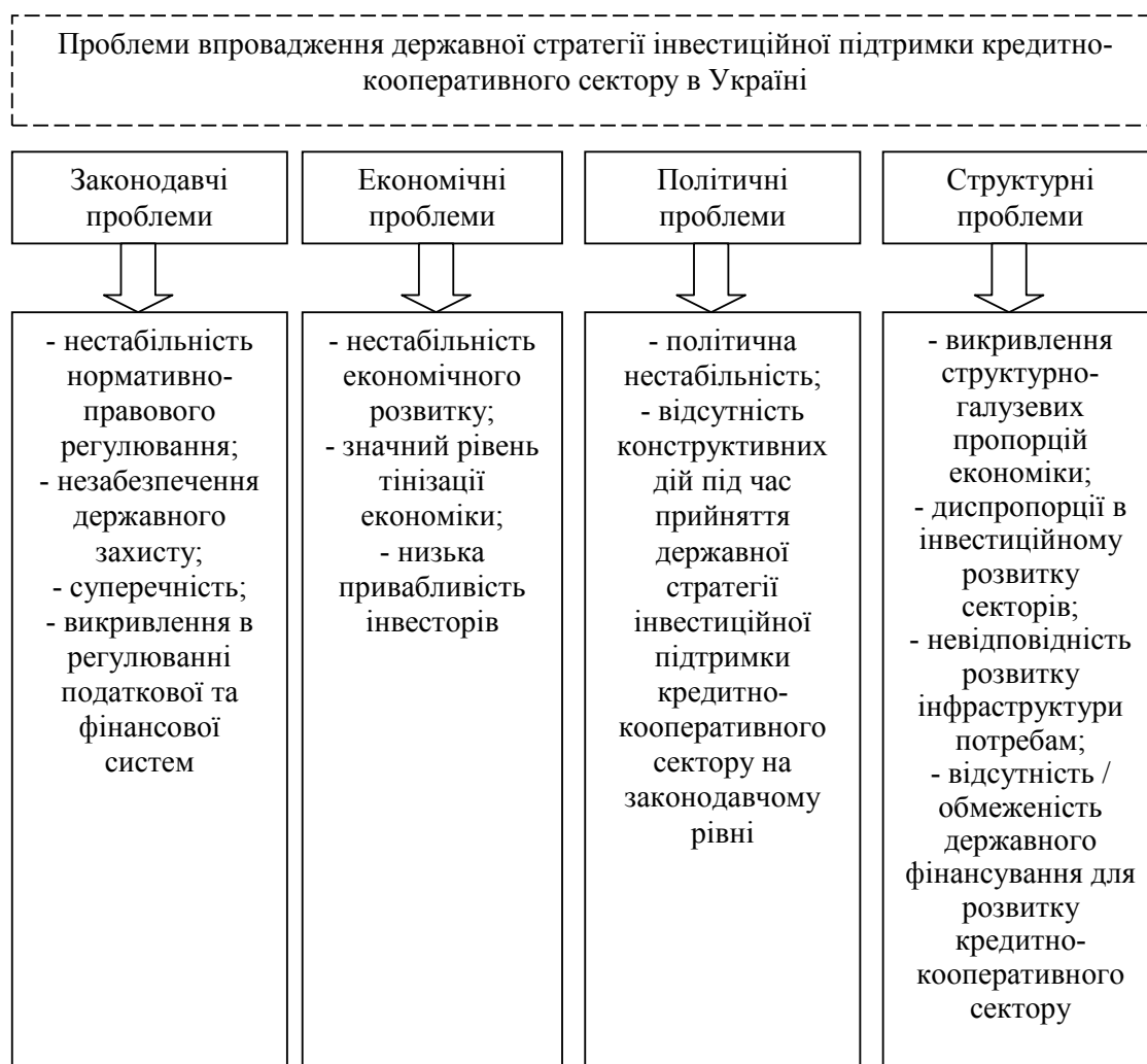
Рис. 1. Проблеми впровадження державної стратегії інвестиційної підтримки кредитно-кооперативного сектору в Україні

Виділення невирішених раніше частин загальної проблеми. Більшість суб'єктів підприємництва та населення не до кінця розуміє сутності кредитних кооперативів. Тому сьогодні нагальними питаннями, які потребують вирішення, є дослідження проблем, що стримують впровадження державної стратегії інвестиційної підтримки кредитно-кооперативного сектору в Україні.