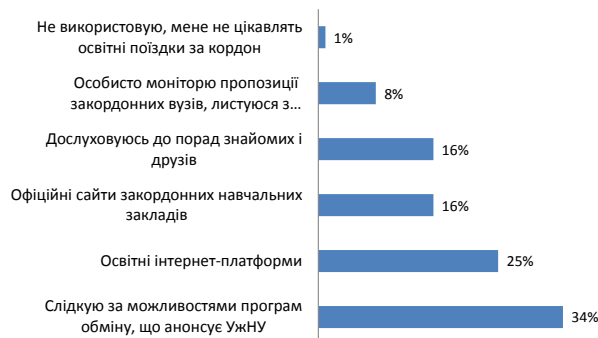
Рис. 2. Розподіл відповідей на запитання анкети «Які джерела інформації щодо можливостей академічної мобільності ви використовуєте?»

Відповіді на запитання «Які фактори під час вибору країни для навчання найбільш