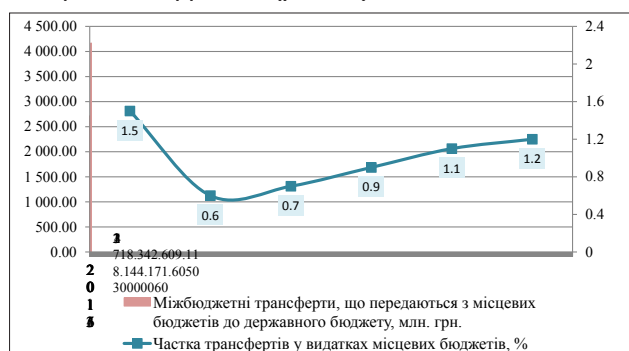
Рис. 3. Динаміка перерахування трансфертів із місцевих бюджетів до державного бюджету за 2011–2016 рр.

До державного бюджету України з місцевих бюджетів у 2016 р. надійшло 4,2 млрд. грн. міжбюджетних трансфертів, що на 32,7% більше за відповідний показник попереднього року. Реверсна дотація становила 3,0 млрд. грн., або 97,8% від запланованого показника на рік. Окрім того, до міжбюджетних трансфертів, що надаються з місцевих бюджетів, належать субвенції на виконання програм соціально-економічного та культурного розвитку регіонів. Такі субвенції перераховано в обсязі 1,2 млрд. грн. У цілому загальний обсяг трансфертів до державного бюджету щодо аналогічного показника 2015 р. збільшився на 1,0 млрд. грн. і становив 1,2% усіх видатків місцевих бюджетів (рис. 3).