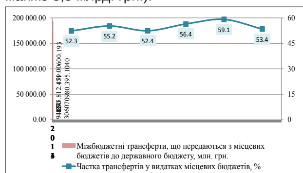
Рис. 1. Динаміка перерахування трансфертів, що передаються з державного бюджету до місцевих бюджетів, за 2011–2016 рр.

Частка міжбюджетних трансфертів у структурі доходів місцевих бюджетів у 2016 р. становила 53,4%, що менше показника минулого року на 5,7 в. п. (рис. 1). Більшість трансфертів, що надійшли з державного бюджету, спрямовувалися на соціально-культурну сферу. При цьому на відміну від минулого року відсутня субвенція на підготовку робітничих кадрів (її фактичний обсяг у 2015 р. становив майже 5,5 млрд. грн.).