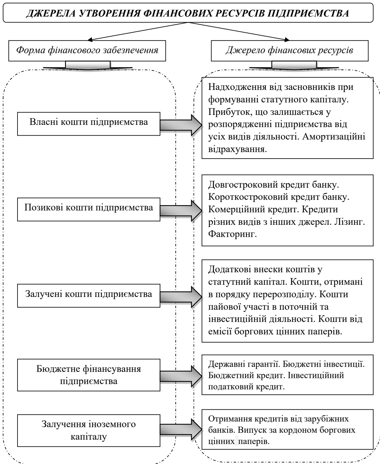
Рис. 1. Джерела утворення фінансових ресурсів підприємства