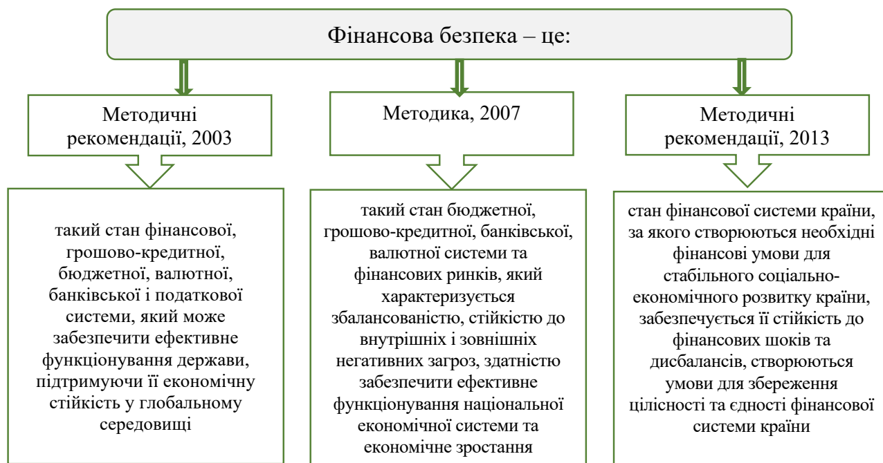
Рис. 1. Еволюція поняття «фінансова безпека методичного характеру»