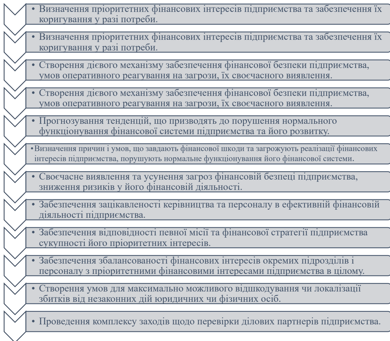
Рис. 2. Основні завдання забезпечення фінансової безпеки підприємства