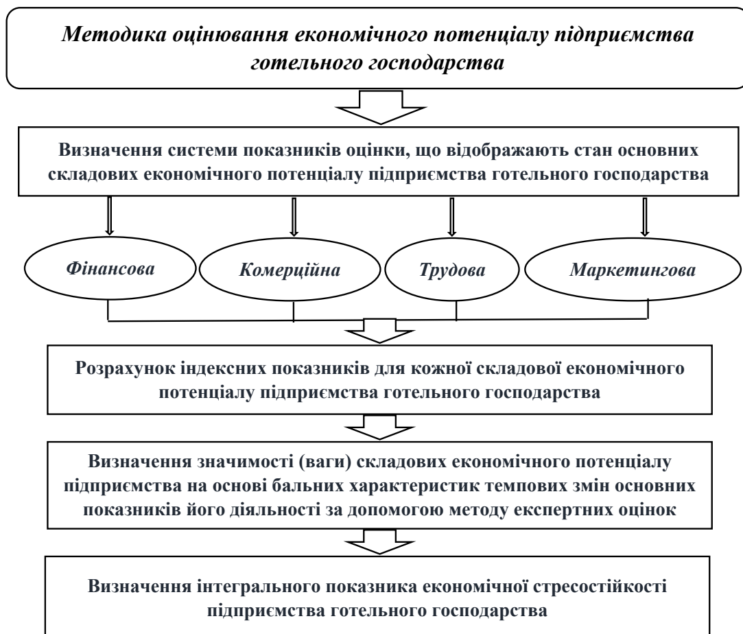
Рис. 1. Методика оцінювання економічного потенціалу підприємства готельного господарства

Другим етапом оцінювання економічного потенціалу є визначення системних показ-