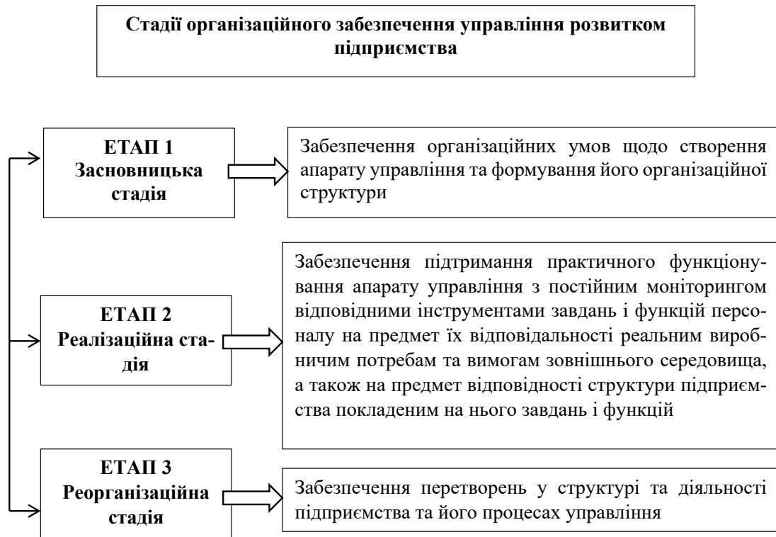
Рис. 2. Стадії організаційного забезпечення управління розвитком підприємства