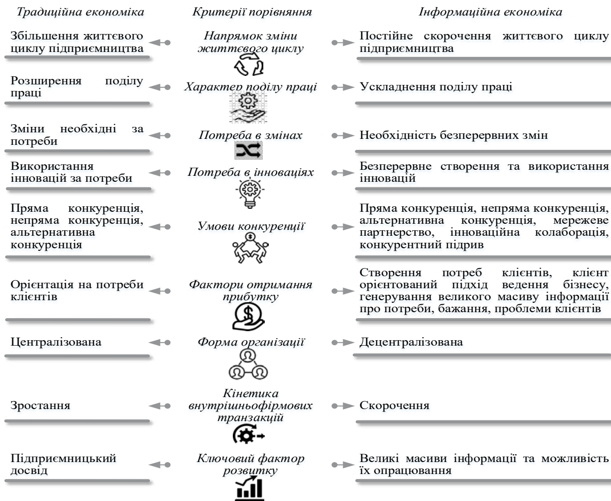
Рис. 1. Порівняльна характеристика критеріїв розвитку підприємницької діяльності в умовах традиційної та інформаційної економіки