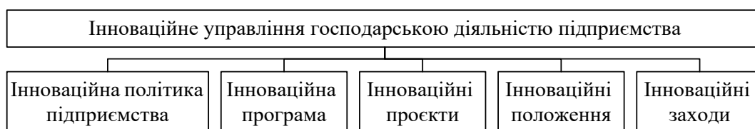
Рис. 2. Форми реалізації інноваційного управління господарською діяльністю підприємства