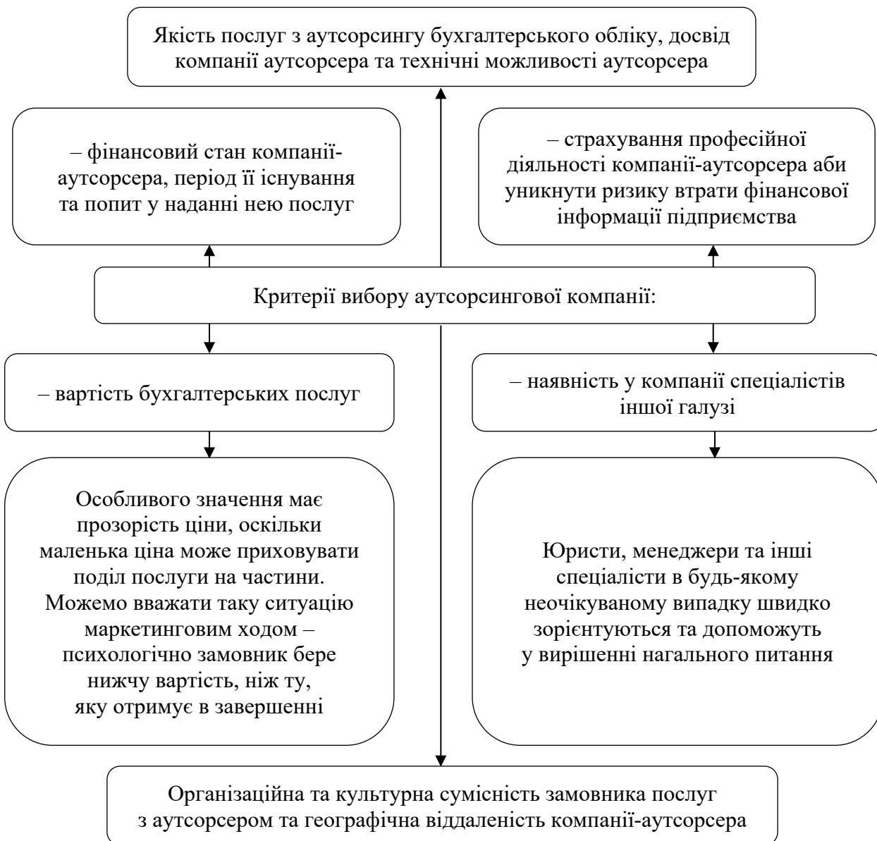
Рис. 1. Критерії вибору аутсорсингової компанії