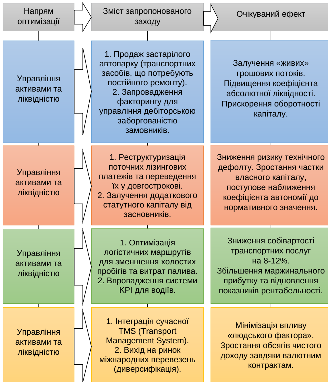
Рис. 4. Комплекс заходів щодо поліпшення фінансового стану ТОВ «АСТ-ЛОГІСТІК»