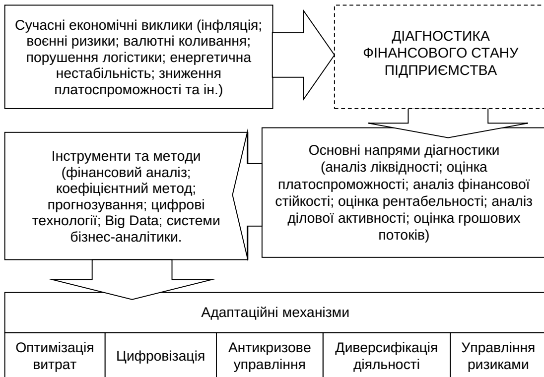
Рис. 3. Структуризаційний контекст діагностики фінансового стану підприємства

Виходячи із вище означеного, бачимо, що ефективність функціонування підприємства значною мірою залежить від його здатності своєчасно оцінювати фінансові ризики, реагувати на зміни економічного середовища та адаптувати систему управління до сучасних викликів. Саме тому діагностика фінансового стану повинна розглядатися не лише як інструмент оцінювання поточних результатів діяльності, але і як основа для формування стратегічних управлінських рішень, спрямованих на забезпечення фінансової стійкості та конкурентоспроможності підприємства. Взаємозв'язок ключових елементів системи діагностики фінансового стану підприємства в контексті адаптації до сучасних економічних викликів представлено на рис. 3.