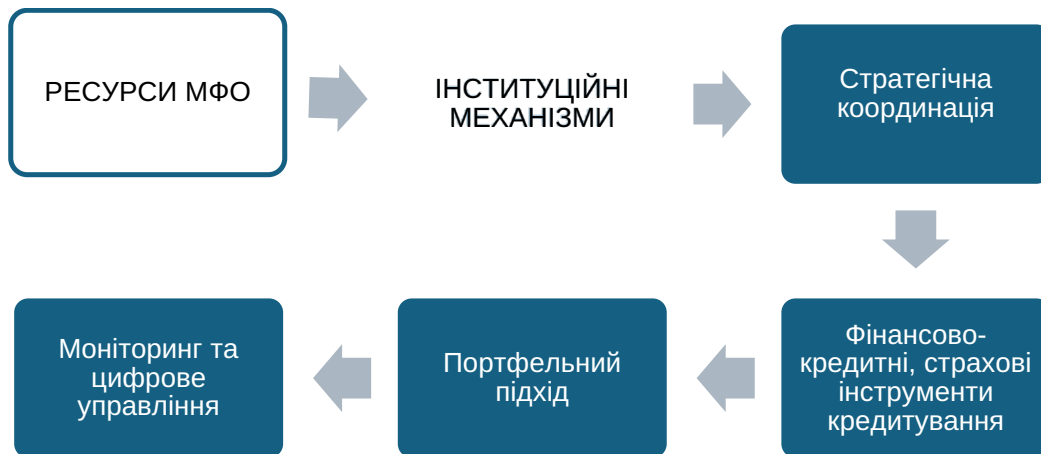
Рис. 1. Ключові механізми інституційної інтеграції ресурсів міжнародних фінансових організацій