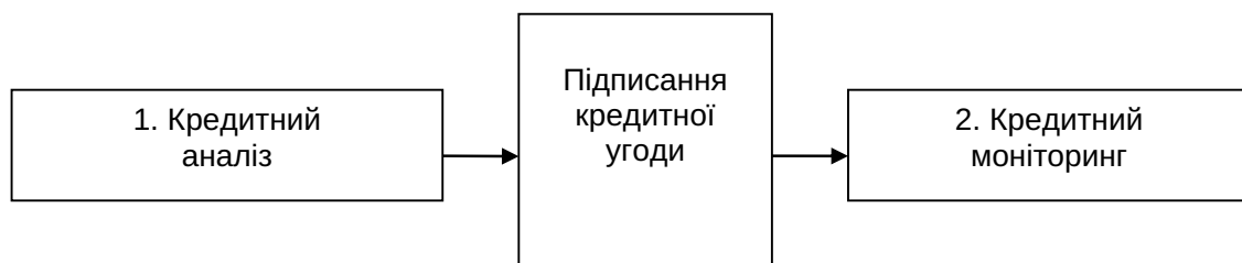
Рис. 3. Загальна схема кредитного процесу