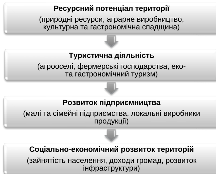
Рис. 1. Модель розвитку агротуризму як інструменту розвитку сільських територій