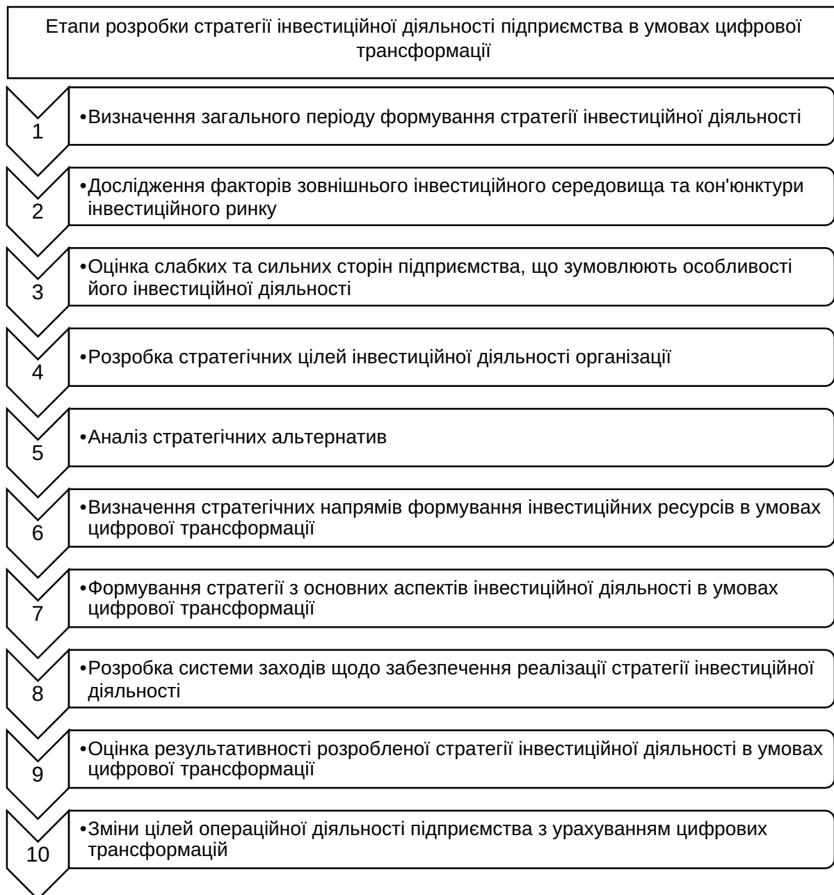
Рис. 1. Етапи розробки стратегії інвестиційної діяльності підприємства в умовах цифрової трансформації