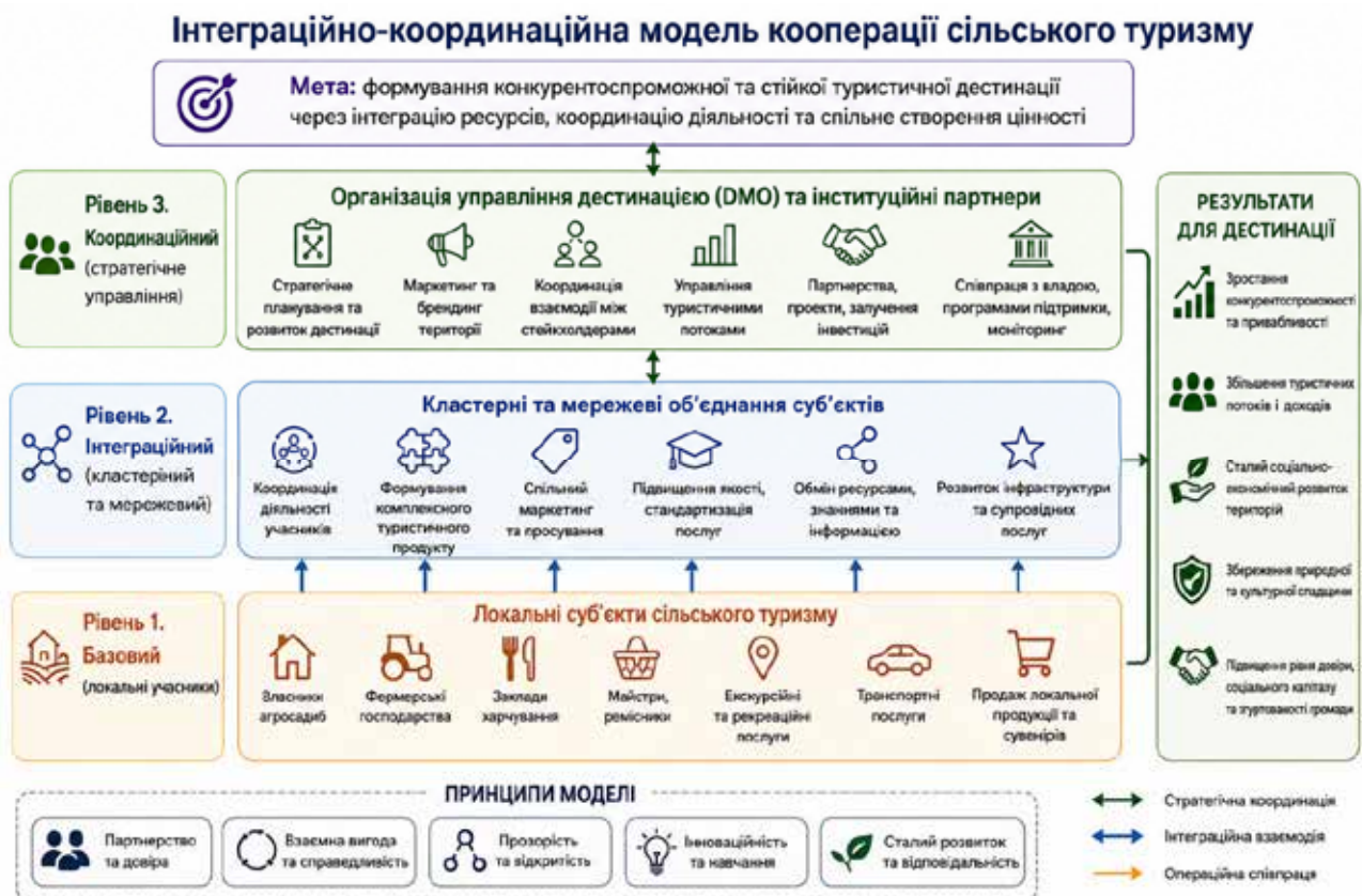
Рис. 2. Інтеграційно-координаційна модель кооперації сільського туризму

Запропоновано концептуальну модель кооперації суб'єктів сільського туризму, що базується на трирівневій структурі взаємодії та відображає логіку формування інтегрованого туристичного продукту в межах дестинації (див. рис. 2). На базовому рівні кооперації функціонують локальні виробники та надавачі