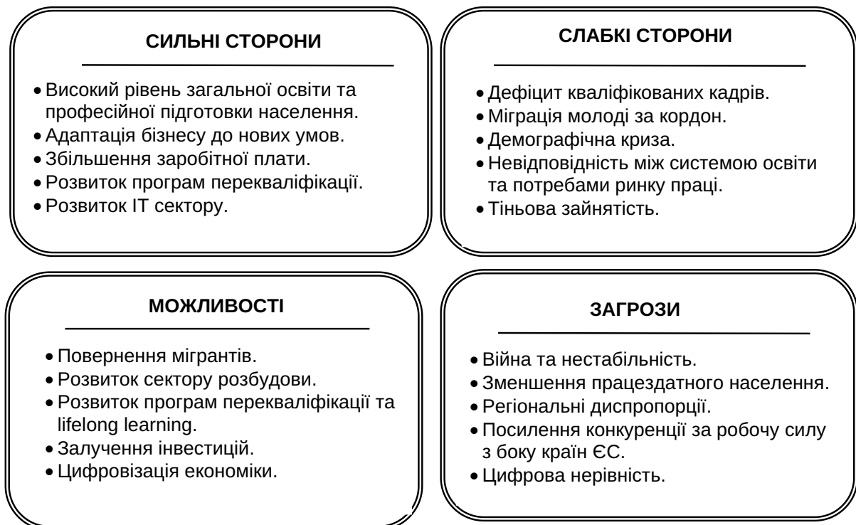
Рис. 1. SWOT-аналіз ринку праці України

Аналітичне узагальнення результатів SWOT-аналізу свідчить, що ринок праці України відзначається високим рівнем загальної освіти та професійної підготовки населення, що забезпечує наявність кваліфікованих кадрів у різних сферах економіки. Незважаючи на те, що останні п'ять років система