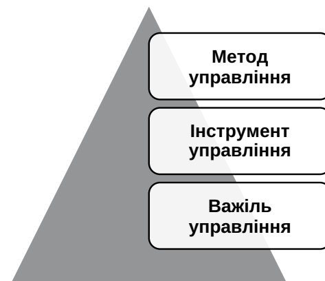
Рис. 1. Ієрархія методів, інструментів і важелів в управлінні фінансовою поведінкою домогосподарств

Інформаційні важелі (їх у рамках державного управління цінами згадують Р. Яковенко й В. Зайченко [31]) чинять дію через зміну обсягу, структури та способу подання інформації. Як приклад таких важелів можемо назвати регулярність фінансової звітності для споживачів, обов'язкове розкриття даних про ризики, форму подання інформації (візуалізація, спрощені формати), порівняльні індикатори фінансових продуктів тощо.