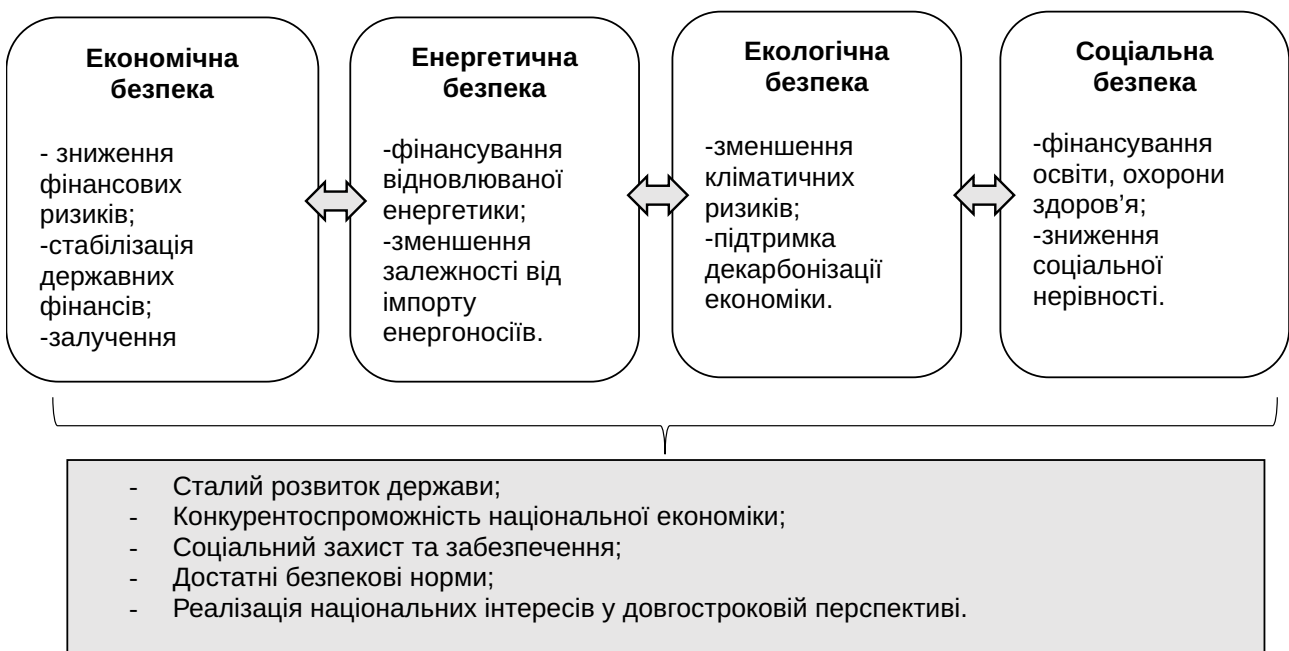
Рис. 1. Вплив сталих фінансів на національну безпеку держави

Реалізація відповідного індикатора визначає економічну складову національної безпеки, сприяє формуванню конкурентоспроможної структури економіки, зростанню продуктивності праці, збільшенню валютних надходжень та зміцненню фінансової стійкості держави. Механізми сталого фінансування є ресурсною основою структурної трансформації економіки, забезпечуючи спрямування