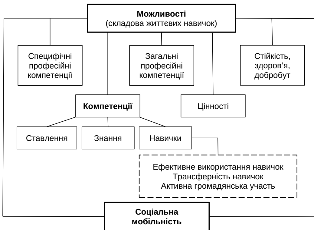
Рис. 1. Вплив можливостей на соціальну мобільність

Необхідно зауважити, що деструктивні зміни значною мірою спричиняють інституційну нестабільність через ослаблення або руйнування освітніх систем, ринку праці, соціальної політики загалом. Зниження економічної активності, звуження можливостей, скорочення пропозиції робочої сили та дефіцит якісної робочої сили, зростання безробіття та неформальної зайнятості, посилення впливу людського капіталу потребують нової моделі функціонування ринку праці, де гнучкість та адаптивність є ключовими факторами стабілізації та розвитку. Крім того, цього вимагають цифровізація та поширення гнучких форм зайнятості як дистанційна робота та гігекономіка. Слід підкреслити, що ці тенденції не є новими. Дистанційна робота, яка стала важливим форматом зайнятості та одним із головних факторів забезпечення конкурентоспроможності економіки у період пандемії COVID-19, набуває значення не лише детер-