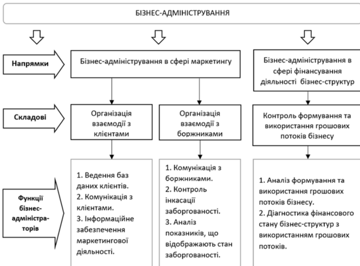
Рис. 2. Напрямки та складові бізнес-адміністрування