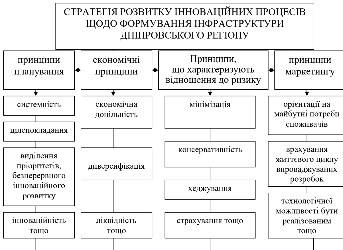
Рис. 2. Система взаємопов'язаних принципів розробки стратегії розвитку інноваційних процесів щодо формування інфраструктури Дніпровського регіону

направляються або в фізичний капітал, або в людський капітал, або в сектор знань. Огляд існуючих трактувань інвестицій свідчить про те, що єдиного визначення даного поняття не існує, проте всі автори згодні з тим, що інвестиції є одним з найважливіших інструментів економічного зростання країни, а управління ними – однією з актуальних завдань національної економіки. Інструментом управління інвестиціями виступає інвестиційна політика, модель якої залежить від обраної економічної теорії, адаптованої до сучасного етапу соціально-економічного розвитку території. Вона є основою переходу на інноваційний шлях розвитку.