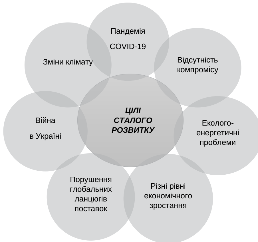
Рис. 1. Причини, які посилюють розрив у досягненні ЦСР