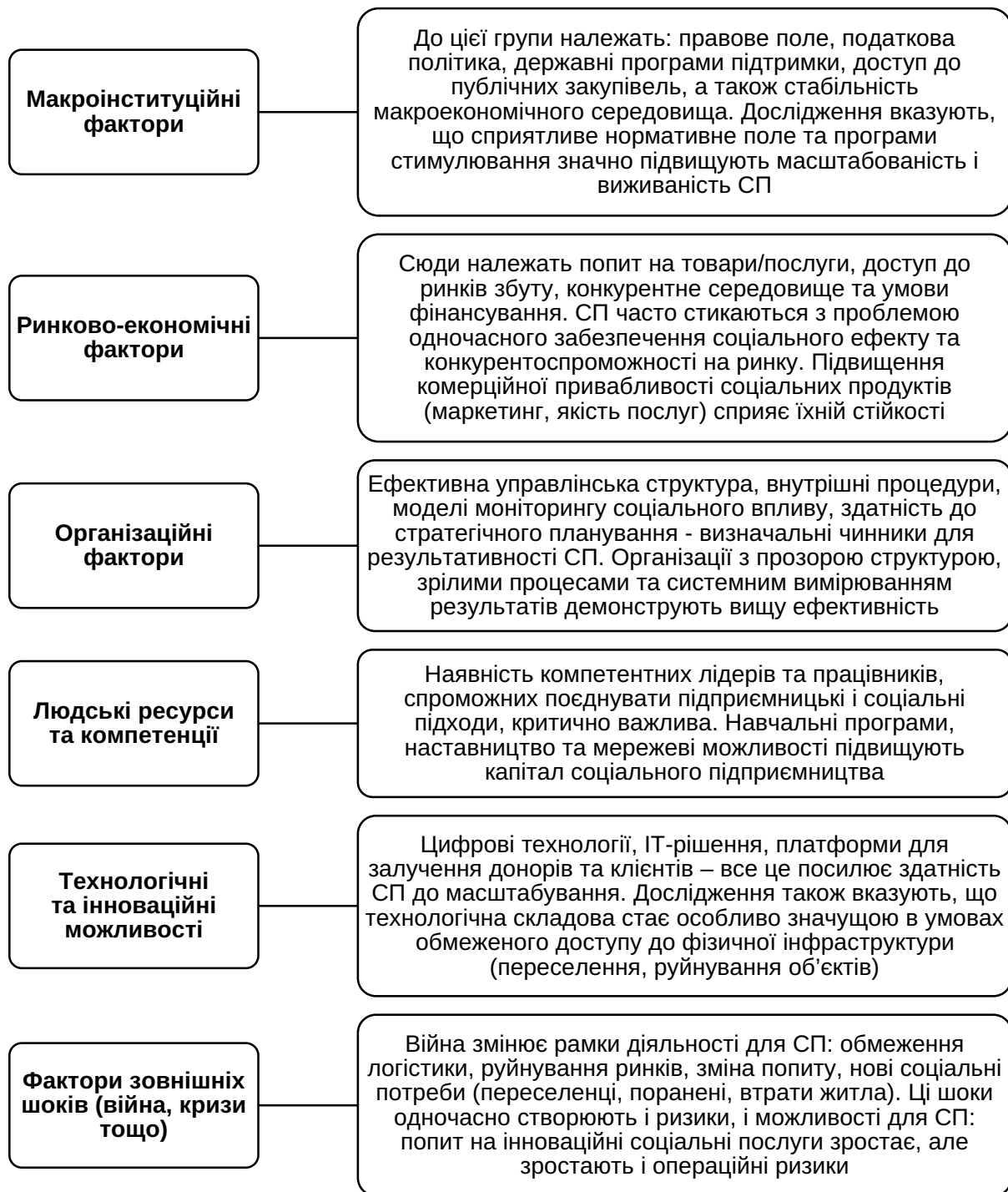
Рис. 2. Фактори, що впливають на ефективність соціального підприємництва