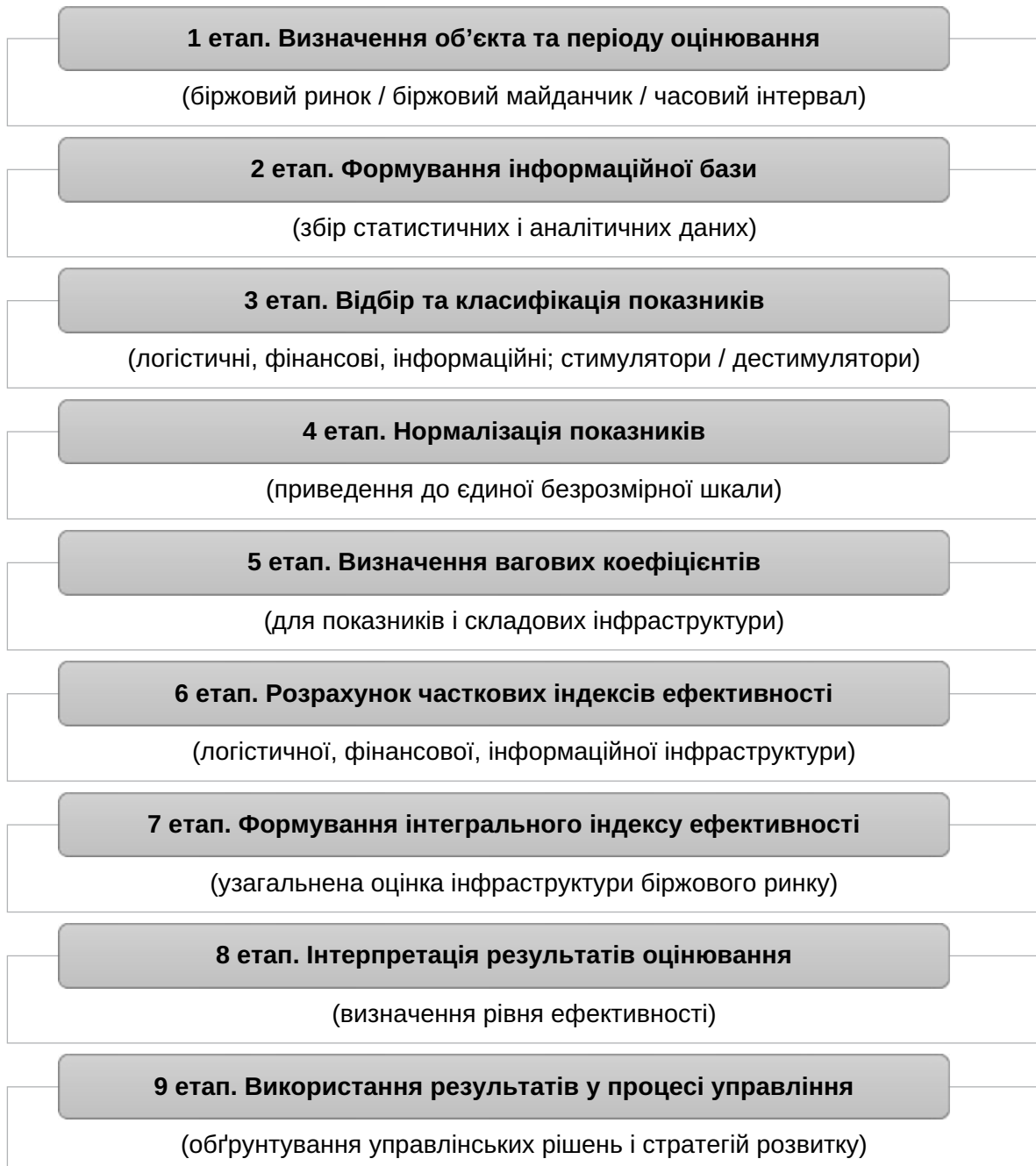
Рис. 2. Алгоритм застосування моделі оцінки ефективності функціонування інфраструктури біржового ринку агропромислової продукції

Особливе значення має аналіз співвідношення часткових індексів, що дозволяє вия-