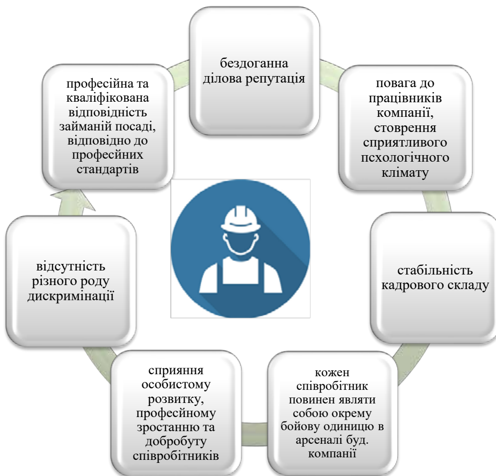
Рис. 2. Складові прозорості кадрової політики будівельного підприємства

Таким чином, транспарентний підхід має використовуватися будівельними підприємствами як визначник (детермінант) довіри до них стейкхолдерів. Але при цьому, важливо наголосити, що транспарентність має бути присутня і у діяльності всіх, хто має відношення до будівництва як такого (органи влади, контролюючі установи, дотичні підприємства). В цьому аспекті, використанню транспарентного підходу у будівництві сприятиме впровадження діджитал-системи управління будівництвом, що використовується для сприяння систематичному та ефективному управлінню будівельними процесами. Система дозволяє користувачам здійснювати контроль над будівельними матеріалами, робітниками та обладнанням у режимі реального часу. Поширення діджитал-системи має важливе значення для забезпечення ефективного управління будівництвом. Це також необхідно для забезпечення точності та надійності публічної