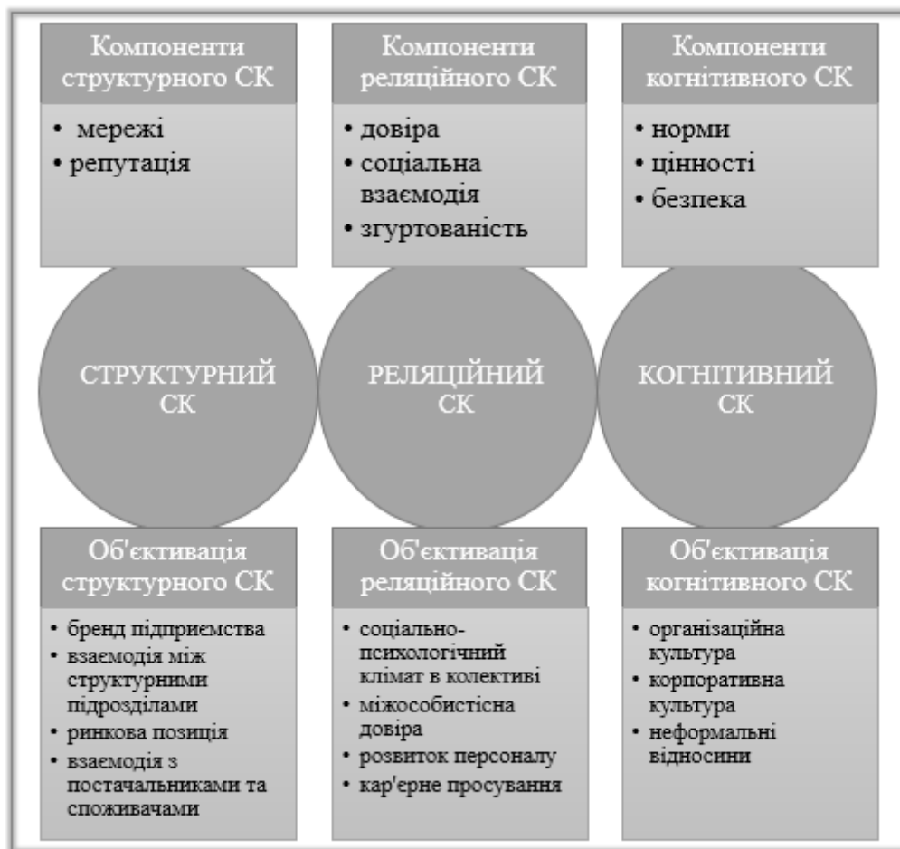
Рис. 1. Структура соціального капіталу підприємства