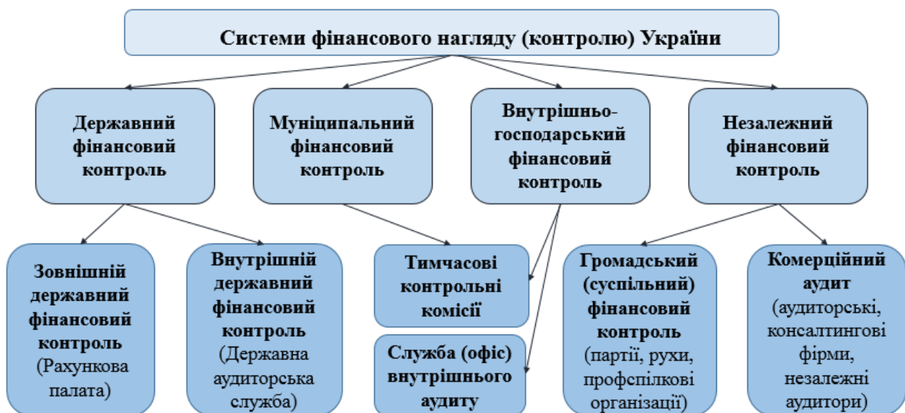
Рис. 1. Системи фінансового нагляду (контролю) України

Погоджуємось із І. Адаменко, який наголошує, що інституціональний механізм фінансової політики у формі економічного інституту визначає норми та положення, встановлює обмеження щодо поведінки та розвитку взаємовідносин учасників фінансової політики задля врегулювання та гармонізації соціально-економічної сфери [11, с. 342].