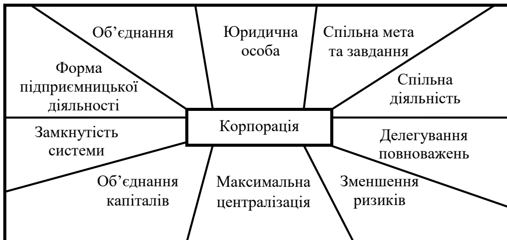
Рис. 1. Змістове наповнення визначення категорії «корпорація» в літературних джерелах

Поєднання економічного та правового аспектів визначає корпорацію як учасника