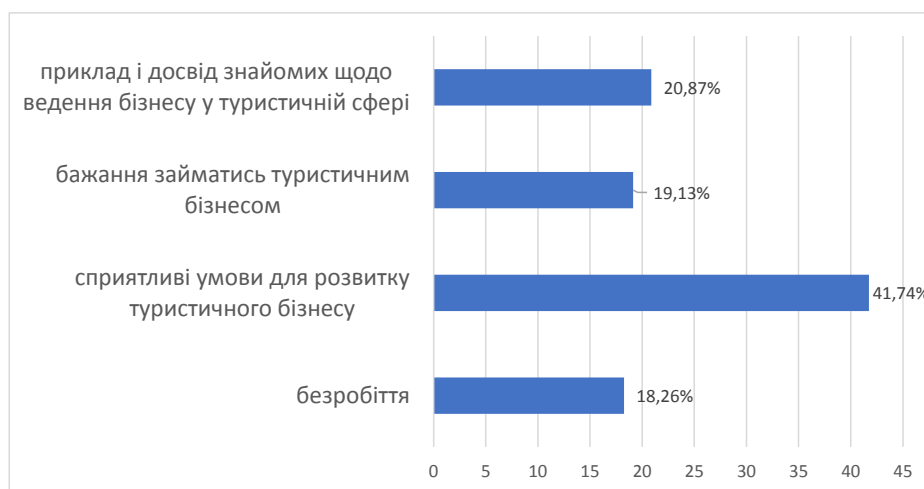
Рис. 1. Розподіл відповідей на запитання «Що спонукало Вас зайнятись сільським туризмом?»