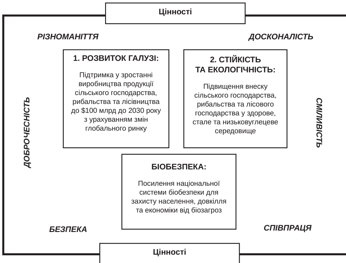
Рис. 3. Модель аграрної політики Уряду Австралії

Окремо варто відзначити земельні права корінних народів Австралії, які визнаються і захищаються через систему «місцевих титулів» ( native title ). Ця система визнає традиційні права корінних народів на земельні та водні ресурси, які можуть бути використані для релігійних, культурних та господарських потреб. Процес визнання «місцевих титулів» складний і включає юридичні процедури, що гарантують дотримання прав корінних спільнот. Це створює унікальну динаміку земельних відносин, де традиційні права