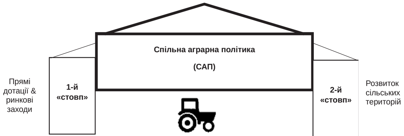
Рис. 1. Структура САП ЄС