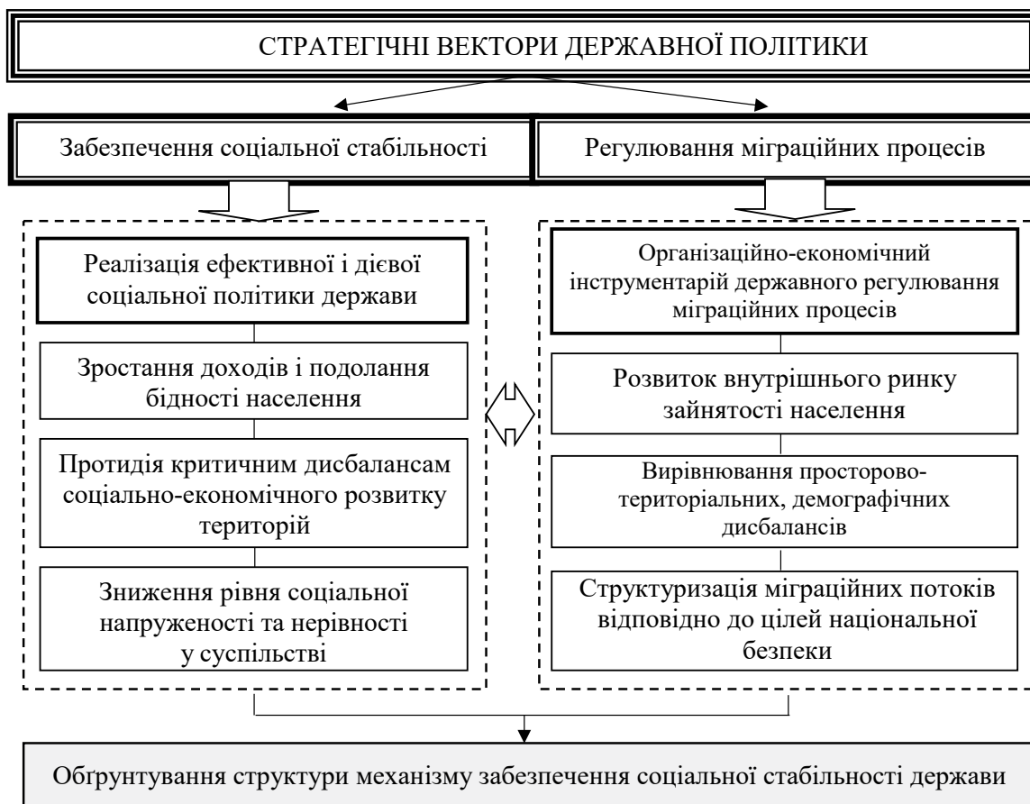
Рис. 1. Модель взаємозалежності процесів забезпечення соціальної стабільності та регулювання міграційних процесів