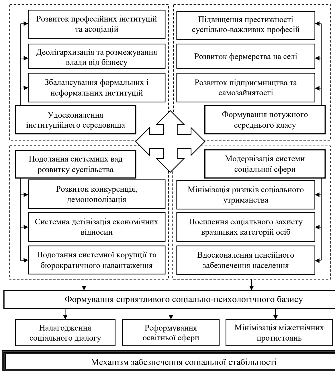
Рис. 3. Структура механізму забезпечення соціальної стабільності України в умовах інтенсифікації міграційних процесів

Ефективне регулювання міграційної активності населення неможливе без культивування в суспільстві ідеї міцного інституту сім'ї, утвердження культурно-духовних і моральних принципів, розвитку почуття національного патріотизму, формування високого рівня соціальної свідомості та відповідальності в населення. Своєю чергою, це потребує налагодження ефективного соціального діалогу між державними інституціями, релігійними організаціями, суспільством та конкретною особистістю, в умовах якого чітко позиціонується роль кожного громадянина та його участь у