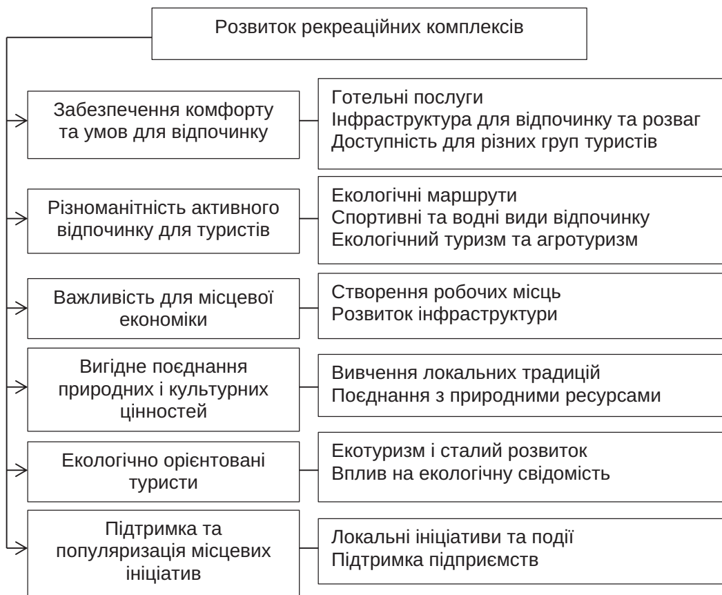
Рис. 2. Розвиток рекреаційних комплексів