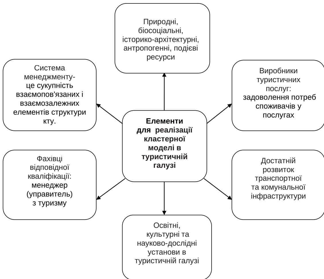
Рис. 2. Елементи, необхідні для реалізації кластерної моделі в туристичній галузі

Відтак, у нашому трактуванні екотуризм включає всі види туризму, орієнтовані на збереження природного довкілля, витворення інтелектуально-гуманістичного світобачення, налагодження гуманних стосунків з місцевим населенням та органами самоврядування, поліпшення фінансово-економічного благополуччя регіонів.