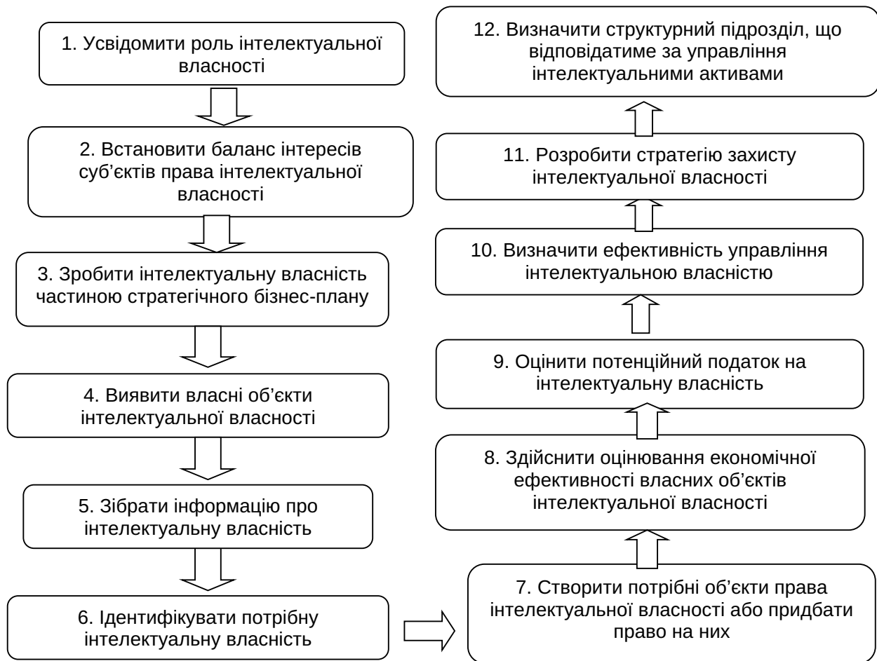
Рис. 3. Алгоритм управління правами інтелектуальною власністю харчових підприємств